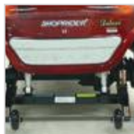
Suspensión trasera parachoques