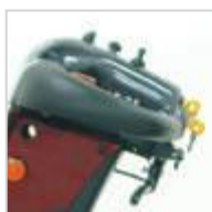
Freno de emergencia