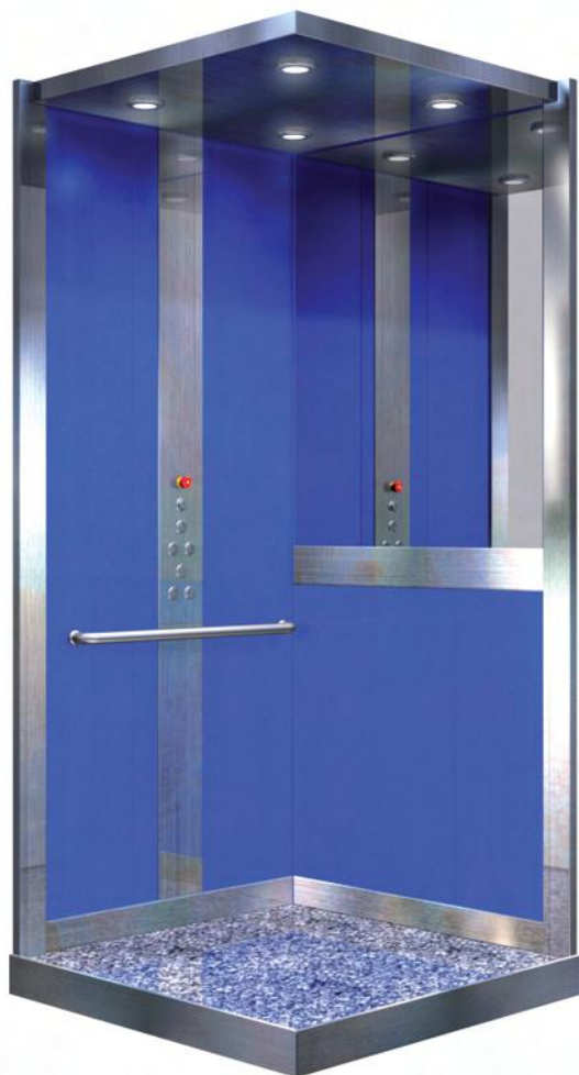
* AZUL MARMARA