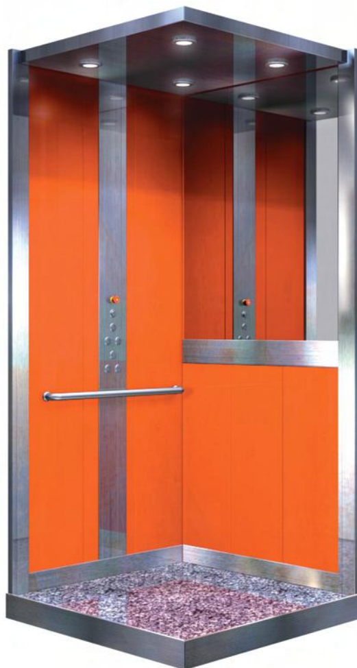
* NARANJA SAGUNTO