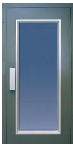
* GRAN MIRILLA