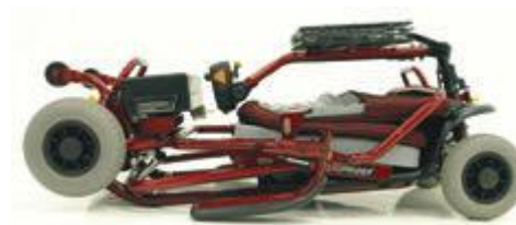
Rápido y fácil de: plegar