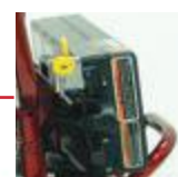
Llaves de baterías