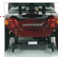
Anti tip wheels