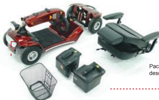
Pack de baterías desmontable