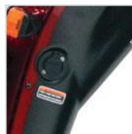
Conector de carga